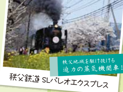
秩父地域を駆け抜ける 迫力の蒸気機関車！ 秩父鉄道 SLパレオエクスプレス