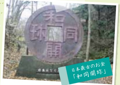
日本最古のお金 「和同開珎」 聖神社と和銅遺跡