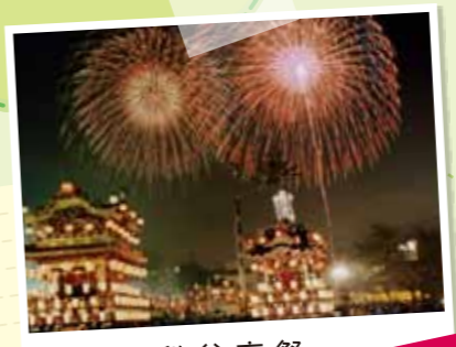
秩父夜祭とは 『京都の祇園祭』、 『飛騨の高山祭』に並ぶ 日本三大曳山祭の一つ！ 秩父夜祭 秩父の冬を彩る 花火と山車の競演