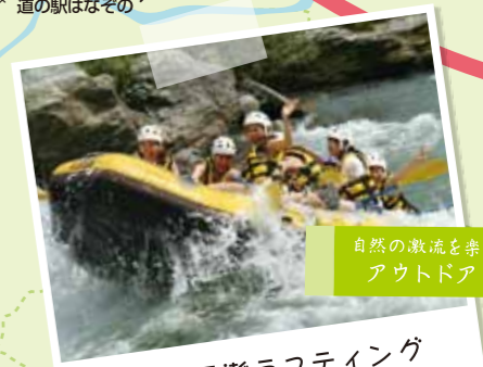
自然の激流を楽しむ アウトドア！ 荒川の長瀬ラフティング